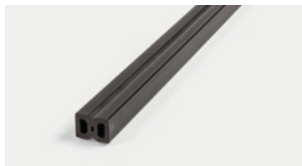
Lista intelaiatura in WPC WPC Framingstrip