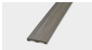
Profilo Piatto Alluminio Flat Alluminium Cover