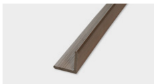
Profilo L Alluminio Alluminium "L" Cover