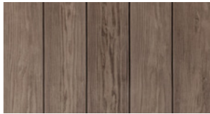
1528 New Brown