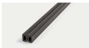
Lista intelaiatura in WPC WPC Framingstrip