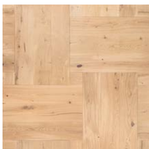
P01 Prelevigato Unfinished

Parquet multistrato 1strip Engineered wood flooring 1strip