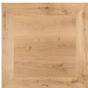
P01 Prelevigato Unfinished

Parquet multistrato 1strip Engineered wood flooring 1strip