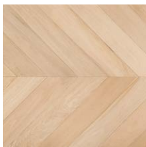
P01 Prelevigato bisellato Unfinished beveled

Parquet multistrato 1strip Engineered wood flooring 1strip