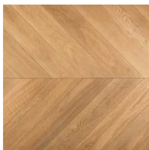
Finiture standard come Standard finishing as Dimora