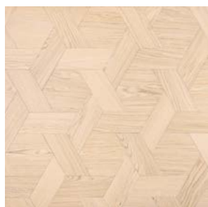
P01 Prelevigato Unfinished