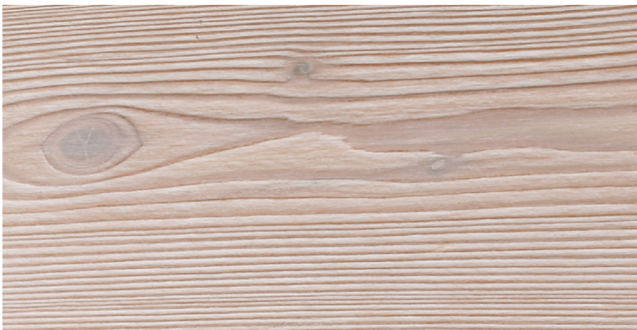
Tavola 3strati Larice Larch

Spessore 15mm Larghezza 190mm Lunghezza 1900mm*