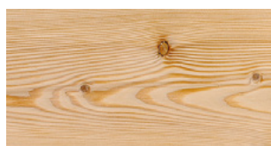
P01 Prelevigato Unfinished

Assito 3 strati 1 strip 3 layers 1 strip