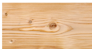
U11 Vernice OIL UV