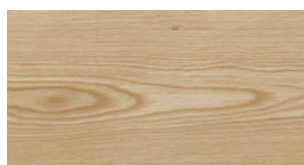
P07 Thermo Prelevigato Unfinished