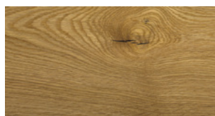
U02 Thermo OIL UV